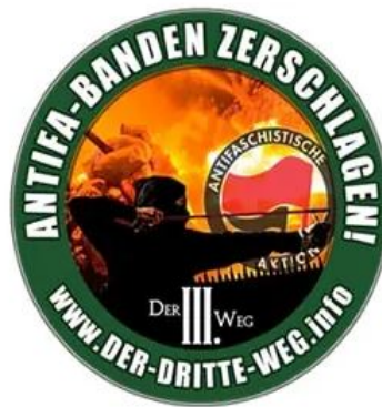
Propagandabild des III. Weg

Im Anschluss an die Forderung, „linksextreme Strukturen zu benennen und zu zerschlagen“, verwies der „III. Weg“ auf „regelmäßige Sicherheitsschulungen“ seiner Arbeitsgruppe „Körper & Geist“. Die im Jahr 2018 gegründete