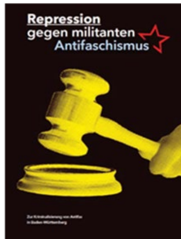
Propagandabild der Perspektive Kommunismus

Am 16. Mai 2020 wurden drei Angehörige der Gewerkschaft „Zentrum Automobile e. V.“ in Stuttgart auf dem Weg zu einer Querdenken-Demonstration durch eine Gruppe von 20-40 Linksextremisten angegriffen und schwer verletzt. Einer der Geschädigten erlitt lebensgefährliche Verletzungen und musste für einen Monat in ein künstliches Koma versetzt werden. In der Folge dieses Überfalls kam es zu mehreren Festnahmen. Gegen zwei Personen wurde Anklage erhoben. Die Gewerkschaft „Zentrum Automobile e. V.“ wird von Linksextremisten aufgrund ihrer vermeintlichen Nähe zur AfD als faschistisch angesehen. Das linksextremistische Bündnis „Perspektive Kommunismus“ (PK) veröffentlichte am 26. März 2021 eine Broschüre mit dem Titel „Repression gegen militanten Antifaschismus“. In der Broschüre, die direkten Bezug auf den Angriff auf die Gewerkschafter nimmt, wird Militanz gegenüber „Faschisten“ „in bestimmten Situationen“ als notwendig und legitim erachtet. Ihrem Selbstverständnis nach wähen sich die Autoren in einem Untergrundkampf vergleichbar mit den jugoslawischen Partisanen während des Zweiten Weltkrieges. Ihrer Ansicht nach sei „die Gewalt die in bestimmten Situationen Teil des antifaschistischen Widerstands sein soll“ gerechtfertigt: