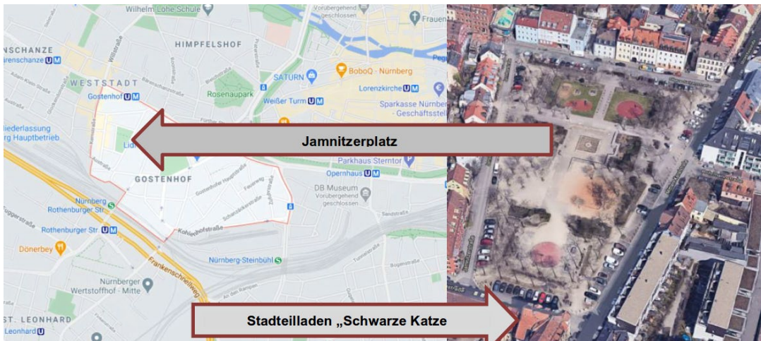
Die Karte des Stadtteils Gostenhof in Nürnberg zeigt die Standorte des Jamnitzerplatzes und des Szene-Lokals „Schwarze Katze“

einer umfassenden Sanierung des Stadtteils, um seinem Ruf als "Glasscherbenviertel" entgegenzuwirken. Gostenhof zählt seit dem Ende der 1980er Jahre zu einem der wichtigsten linksextremistischen Kristallisationspunkte in Bayern. Der Jamnitzerplatz, im Zentrum von Gostenhof gelegen, ist einer der bevorzugten Treffpunkte der örtlichen linksextremistischen Szene. In direkter Umgebung befindet sich auch seit mehreren Jahren das Szene-Lokal „Schwarze Katze“, das Linksextremisten als Treffpunkt und Anlaufstelle dient. Das Lokal ist Teil des „Selbstverwaltete[n] Kommunikationszentrum[s] Nürnberg e. V.“ (KOMM e. V.), das ebenfalls von linksextremistischen bzw. linksextremistisch beeinflussten Gruppierungen aufgesucht wird. Dort treffen sich, neben der postautonomen „Roten Hilfe“ (RH), die autonomen Gruppierungen „Organisierte Autonomie“ (OA) sowie die „Revolutionär Organisierte Jugendaktion“ (ROJA), die als unabhängige Jugendorganisation der OA zu betrachten ist.