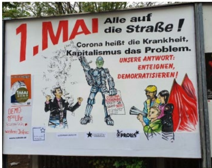
Demonstrationsaufruf zu 1. Mai-Protesten in Nürnberg

Verstößen gegen die Versammlungsaufgaben, etwa in Zusammenhang mit Mindestabständen, verknoteten Seitentransparenten und dem Abbrennen von Pyrotechnik, störungsfrei. Im Anschluss an die Versammlung fanden im Szenestadtteil Gostenhof mehrere stationäre Kleinkundgebungen als