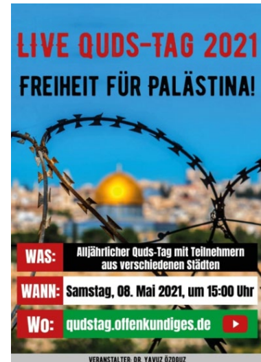
Propagandabild zum „al-Quds-Tag“

Im islamistischen Spektrum findet sich die Zusammenführung realweltlicher Aktivitäten mit dem virtuellen Raum insbesondere beim „al-Quds-Tag“ („Jerusalemtag“), in dessen Rahmen seit 1979 jährlich am Ende des islamischen Fastenmonats Ramadan zur „Befreiung“ Jerusalems aufgerufen wird. Pandemiebedingt findet die Veranstaltung seit zwei Jahren sowohl digital als auch in kleinerem Maßstab auf der Straße statt. Wie bereits im Jahr 2020 wurde der normalerweise in Berlin stattfindende „al-Quds-Tag“ aufgrund der geltenden Corona-Beschränkungen auch in diesem Jahr abgesagt und stattdessen als fast zweistündiger, moderierter Livestream mit Live-Beiträgen u. a. aus Berlin, Bremen, Hannover und Nordrhein-Westfalen abgehalten. Während 2019 bei der letzten realweltlichen Veranstaltung in Berlin circa 1.200 Teilnehmer anwesend waren, wurde die diesjährige Live-Übertragung unter dem Motto „Live Quds-Tag 2021 – Freiheit für Palästina!“ auf YouTube rund 3.400 Mal abgerufen. Somit wurde online zwar ein nahezu drei Mal so großes Publikum erreicht, allerdings blieb eine größere mediale Berichterstattung zum „al-Quds-Tag“ weitgehend aus und auch die ansonsten üblichen Gegendemonstrationen fanden nicht statt. Letztlich dürfte das Ereignis trotz hoher Klickzahlen einer breiteren Öffentlichkeit entgangen sein.