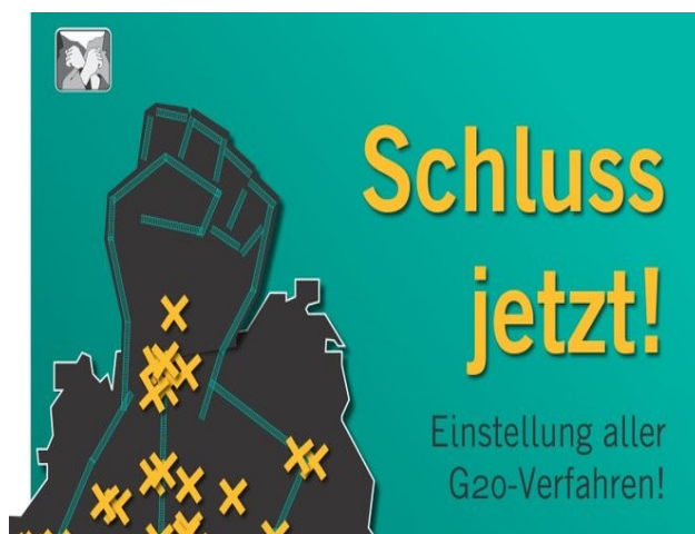
Propagandabild Rote Hilfe

Die Aufarbeitung des Hamburger G20-Gipfel 2017 ist nach wie vor von großem öffentlichen Interesse. Am 3. Dezember 2020 begann der erste der sogenannten „Rondenberg“-Prozesse vor dem Hamburger Landgericht. Den Angeklagten wird vorgeworfen, als Teil einer Gruppe von etwa 200 De-