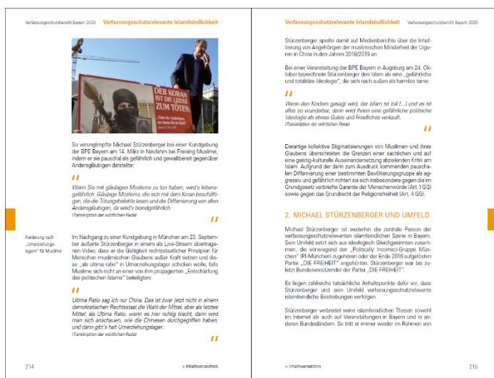
Auszug: Verfassungsschutzbericht Bayern 2020, Seiten 214/215

„Ultima Ratio sag ich nur China. Das ist zwar jetzt nicht in einem demokratischen Rechtsstaat die Wahl der Mittel, aber als letztes Mittel, als Ultima Ratio, wenn es hier richtig kracht, dann wird man sich anschauen, wie die Chinesen durchgegriffen haben, und dann gibt's halt Umerziehungslager.“