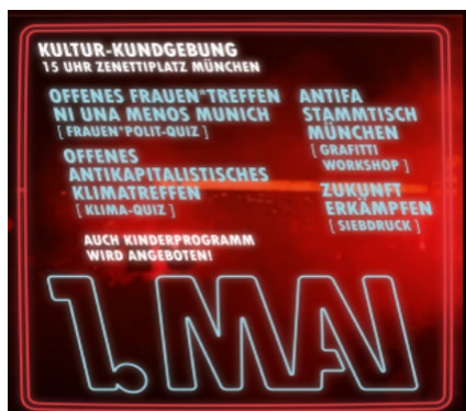
Internetaufruf zu 1. Mai-Protesten in München

Der 1. Mai hat als „Kampftag der Arbeiterklasse“ für die linksextremistische Szene eine besondere Bedeutung. Trotz der pandemiebedingten Beschränkungen und Auflagen waren in zahlreichen deutschen Städten in Teilen linksextremistisch beeinflusste Kundgebungen und Demonstrationen zu verzeichnen, u. a. in Aschaffenburg, Augsburg, Bamberg, Ingolstadt, Regensburg und Würzburg. Wie bereits im Vorjahr wurden die Großveranstaltungen des Deutschen Gewerkschaftsbundes in München und Nürnberg abgesagt bzw. als Online-Veranstaltung durchgeführt. Die linksextremistische Szene nutzte daher auch dieses Jahr die Gelegenheit, eigene Veranstaltungen auf die Beine zu stellen und zahlreiche Personen für die Teilnahme an den Demonstrationen zu mobilisieren.